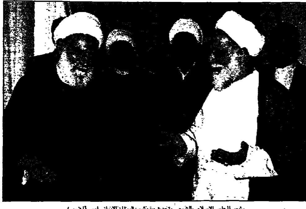
رئيس المجلس الإسلامي الشيعي يقبض مع رئيس البرلمان الإيراني أسد

وأضاف أن الزيارة عززت دور الدبلوماسية الفرنسية في الشرق الاوسط.